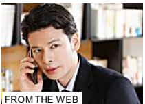
FROM THE WEB

浅野いにおが描きおろしたスペシャルマンガを公開中 (ふんわり妄想マンガシアター by ふんわり鏡月)