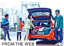
FROM THE WEB

忙しい朝ですら徹底的に効率化？外資系エリート「超効率的な生き方」(Gillette by P&G)