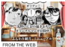
FROM THE WEB

清原和博容疑者「永久追放」発言の杉村太蔵へ、上西小百合議員「馬」(Entertainment)