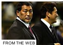
FROM THE WEB

清原和博容疑者「永久追放」発言の杉村太蔵へ、上西小百合議員「馬」(Entertainment)